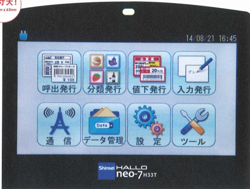
H33T (3インチモデル) / 画素数480x272 タッチパネル付きカラー液晶 (横型)