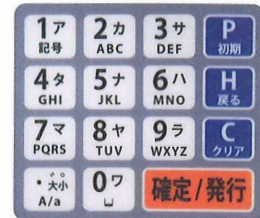
H23T (タッチキーボード)