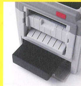
▲バッテリーパック [BH-700]

リン酸鉄リチウムイオン電池は、他のリチウム イオン電池に比べて耐久性に優れ、長寿命化を 実現。ランニングコストを軽減します。また発火 リスクも低く、安全性の高さも自慢です。