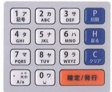
H33T (ボタンキーボード)